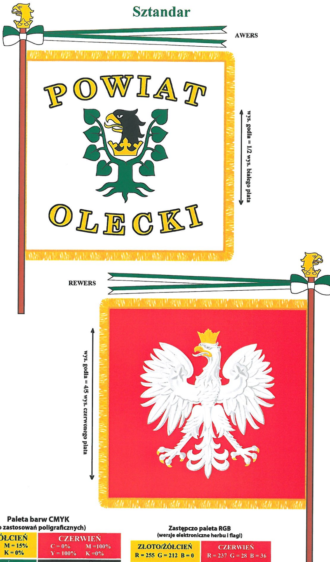
Paleta barw CMYK (do zastosowań poligraficznych)

załącznik nr 4 do uchwały Nr XXII/141/2013 z dnia 30 sierpnia 2013 r.